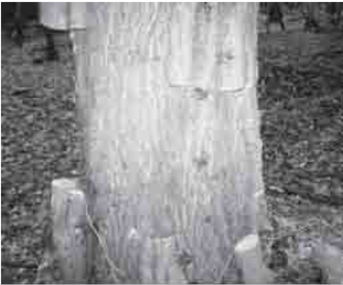
Klimop op de eiken doorgezaagd