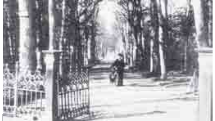
De oprijlaan plm. 1930