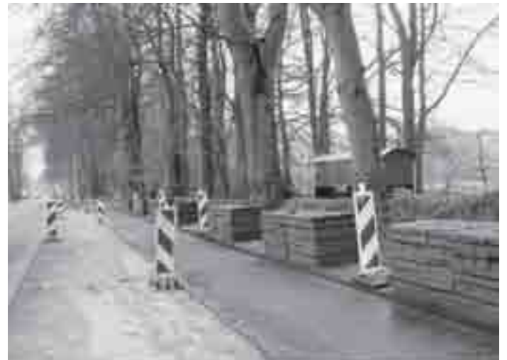
De nieuwe parkeerplaatsen

De overgebleven eiken staan er kaal bij, velen niet echt vitaal met ijle kruin, beschadigde stammen en nog dode hout.