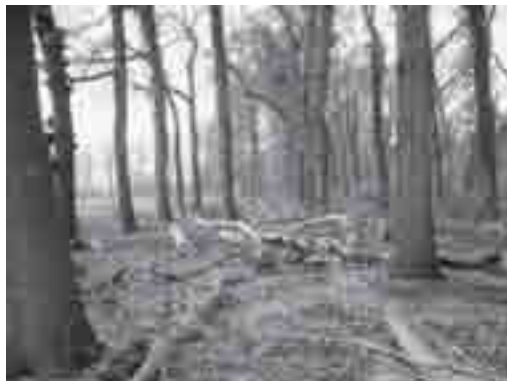
Kaalslag langs de oprijlaan