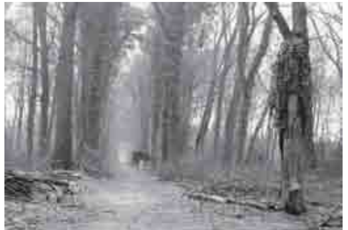
Zicht op de laan: nu is de klimop er nog

Ook vandaag weer klimt een compleet gezin (vader, moeder en 3 kinderen) in deze beuk. Het mooiste klimrek dat je kunt bedenken en het bladerdek eronder het zachtste val kussen. Ik heb het zelf een keer uitgeprobeerd. Zal deze boom ontsnappen aan de motorzaag?