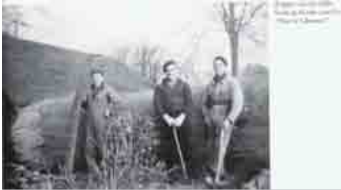
De boswerkers in 1930 met een enorme beukenstam

En of de grote omgevallen beuk in het plan paste en heeft mogen blijven.