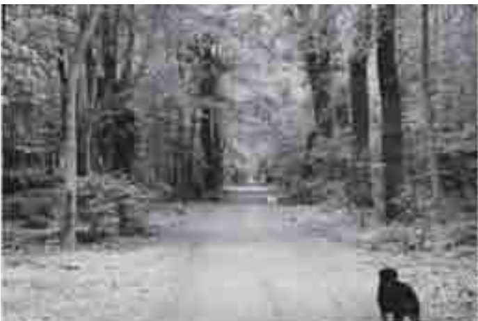
De oprijlaan in de zomer van 2007

Tot 15 maart hebben de boswerkers de tijd om de hele laan onder handen te nemen. Dan moet het klaar zijn bij de start van het broedseizoen. Het grote werk tussen de boerderij in het bos en de Rijkstraatweg moet nog gedaan worden. In