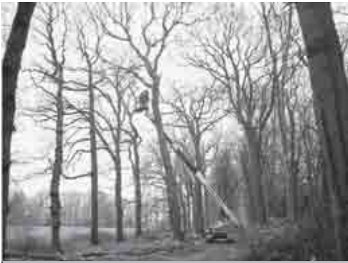
De boswerkers van vandaag met hun hoogwerker

ruimte te geven aan de laan-eiken. Het is een enorm lawaai van motorzagen en takken-versnipperaars. Spechten en reigers zijn voorlopig gevluht.