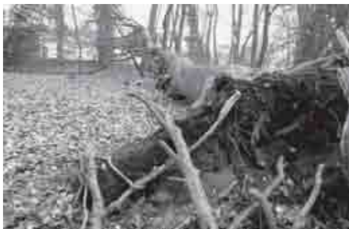
De omgevallen klim-beuk

De boswerkers zijn begonnen aan de kant van de Meentweg en werken zo naar voren. Eerst wordt de onderbegroeiing van hulst en andere bosjes verwijderd; daarna gaat een ploeg verder met de kleinere bomen. En de eerste grote beuken zijn gevallen om